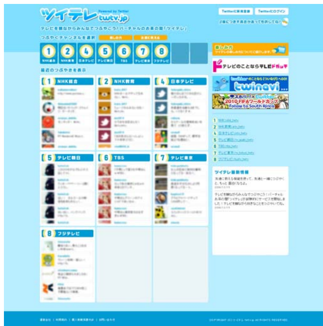
トップページ イメージ

テレビ欄形式で、キー局全ての放送中番組に対するつぶやきを一覧表示、どこの番組が、何で盛り上がっているかを俯瞰できます。